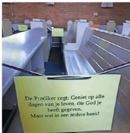
De kerk in Oudehorne laat zestig mensen toe.