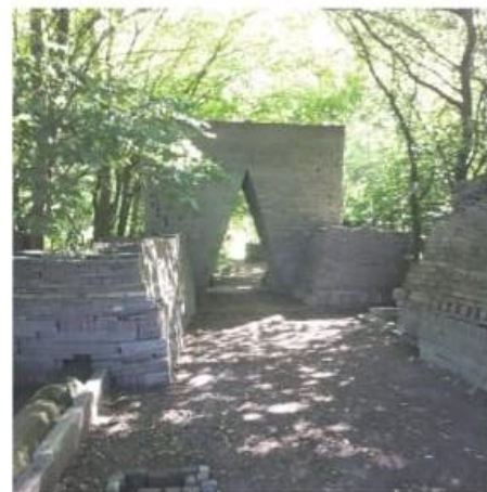
De hemelpoort van de ecokathedraal in Mildam.